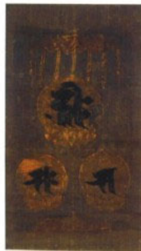
刺繍阿弥陀三尊種子懸幅 9 町指定

鍔口とは、社寺のお堂の軒につるして網で打ちならす仏教具。全体が肉厚で、周縁に二重の圓縁、中ほどに三重の圓縁を回らせ南北朝から室町期の特徴をもつ。応仁元年(1467)の銘がある。直径23cm、厚さ8cm。体験だった五十嵐家のお堂にあったもの。