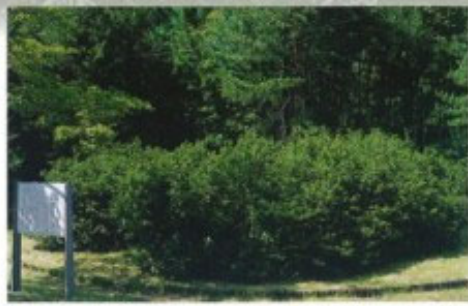
比良林のサラサドウゲン 19 県指定 福島県内の文化財登録番号

アカミノアブラチャン 21 町指定 赤い実をつけるアブラチャン(クスノキ科)で、町内でも長浜宇後山地区にのみ自生。治承4年(1180)、宇治川の戦いで敗れた高倉宮以仁王の郎党が追手の大将・石川冠者有光の首をはね、その血を浴びて実が赤くなったと伝えられている。