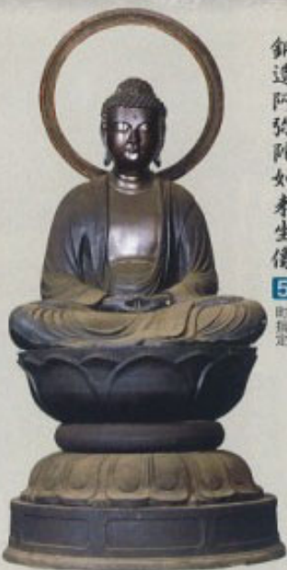
鋼造阿弥陀如来坐像 5 町指定

元文2年（1737）、瀧泉寺中興4世の快宋が本願主となり造立。作者は佐野天明（栃木県）の長谷川亦布で、天明期を代表する銅佛師の一人、弥市の作は、白河、柳屋にも見られるが、会津では瀧泉寺のみで希少。像高69cm。