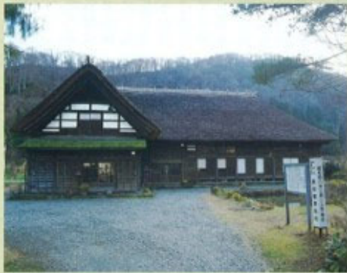
長谷部家住宅 ③ 県指定

成法寺境内にある和様と唐様をとりまぜた端正な観音堂。永正9年(1512)の逃札札から室町時代後期の建築とみられる。聖観音菩薩坐像とともに中世の只見地方の高い文化水準がうかがえる。桁行3間、梁間3間。御蔵入三十三観音一番札所。