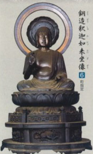
鋼造釈迦如来坐像 6 町指定

元文3年（1738）、瀧泉寺中興4世快宋の没後、弟子の伝宋により造立。作者の早山安次は、中世から会津を本貫とする早山佛師の12代を継いだ人物、土津神社燈籠や鶴ヶ城の時鐘を鋳造した作者として知られる。像高63cm。