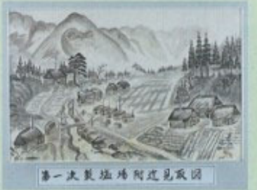
第一製塩場附近見取図

塩沢集落では古くから山塩の生産を行っていた。その製塩の様子を描いた明治末期の図3枚、昭和22年の図1枚、解説文2枚の計6枚からなる。山塩生産の歴史や技術を知る上で極めて重要であり、全国的に見ても価値の高い資料。