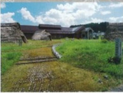
窪田遺跡 12 県指定

奥会津地域の縄文時代から弥生時代の生活を知る貴重な遺跡。縄文・弥生住居跡7棟が発掘され、珍しい再葬墓が発見された。隣接して会津只見考古館があり、さまざまな土器、石器、土偶、装飾品などの出土資料を公開している。指定面積2,200㎡。