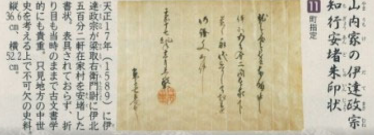
山内家の伊達政宗知行安堵朱印状 11 町指定

天正17年(1589)に伊達政宗が梁取右衛門尉に伊北五十分二軒在家村を安堵した書状。表具されておらず、折り目も当時のままで古文書学的にも貴重。只見地方の中世史を考える上で不可欠の史料。縦36cm、横52cm。