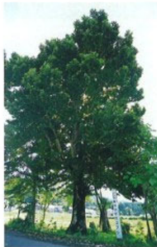
黒谷川の大コブシ 23 町指定

大曾根山の山麓、標高720mに広がる面積23haの湿原。全体にヤマドリゼンマイの群落が広がり、ワタスゲの白い果穂やレンゲツツジのオレンジ色の花が咲く7月初旬が見ごろ。四手折々の花に彩られるが、秋の草紅葉も風情がある。