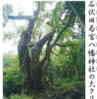
石伏旧若宮八幡神社の大クリ 22 町指定

幹回り23m、直径73cm、樹高20mというキタコブシの巨樹。黒谷川左岸の風光明媚な場所に生育し、枝を張った扇形の樹形はみごとく、この地域のシンボルとなっている。木全体を真っ白におおう純白の花は、4月中旬が見ごろ。