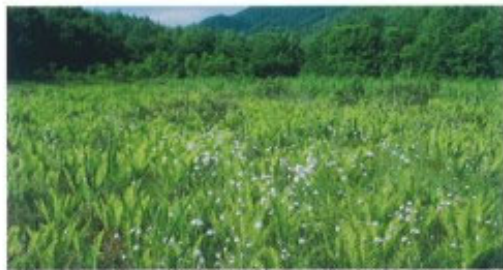
大曾根湿原 20 町指定

根周りが4mにもなるサラサドウゲン(ツツジ科)の巨木。南北16m、東西14mもの大きな群落をつくる。治承4年(1180)、宇治川の戦いで敗れた高倉宮以仁王が、当地でこれを愛でられて以来、霊木としてあがめられてきたという。