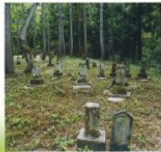
布沢木地師集落跡 14 町指定

木地師とは、ろくろを使い椀などの木工品をつくる職人集団をいう。ここでは寛政期から慶応期までの70年間、布沢宇東松山地区のブナ林に居住していた。山林内に住居跡、棚池跡、墓石が残っており往時をしのぶことができる。指定面積3,654.4㎡。