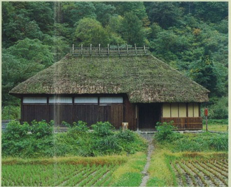
旧五十嵐家住宅 ② 国指定

江戸時代、叶津番所と呼ばれ、会津と越後を結ぶ八十里越の関所として通行人や物資の出入りを監視した。叶津村名主宅でもあり、明治時代には戸長役場として使用された。桁行13間近い規模の大きな蔵中門通りで、江戸時代後期の建築。