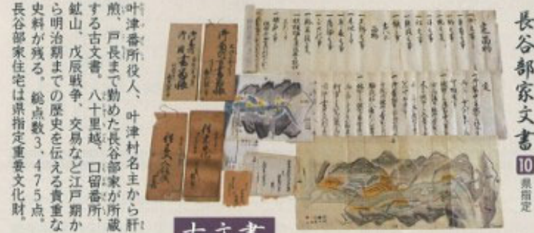
長谷部家文書 10 県指定

早乙女踊りは、早乙女、道化、囃子が各戸を訪れ、その年の豊作を祈願する。現在、小林は2月第1土曜日、梁取は新暦1月14日に近い土曜日に開催される。梁取神楽は鹿島神社(旧南郷村)の御遠宮の際、奉納されてきた歴史の古い神楽。