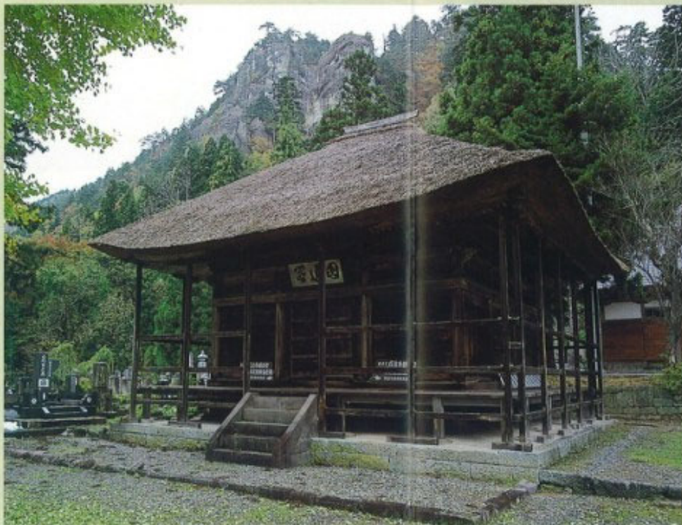
成法寺観音堂 ① 国指定

成法寺境内にある和様と唐様をとりまぜた端正な観音堂。永正9年(1512)の逃札札から室町時代後期の建築とみられる。聖観音菩薩坐像とともに中世の只見地方の高い文化水準がうかがえる。桁行3間、梁間3間。御蔵入三十三観音一番札所。