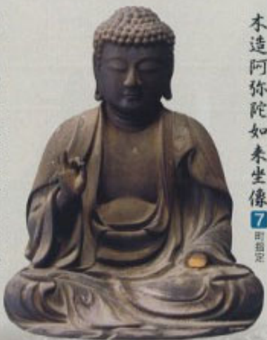
本造阿弥陀如来坐像 7 町指定

やさしく穏やかな表情、洗練された作風、聖跡を残す丁寧な仕上げから中央の作風である。南北朝時代の優れた造形を備える作例で、この時代における只見地方の文化水準の高さがわかる。カツラ材、寄木造、彫眼。像高21cm。