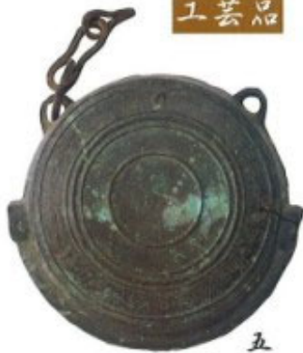
五十嵐家旧蔵鍔口 8 県指定

鍔口とは、社寺のお堂の軒につるして網で打ちならす仏教具。全体が肉厚で、周縁に二重の圓縁、中ほどに三重の圓縁を回らせ南北朝から室町期の特徴をもつ。応仁元年(1467)の銘がある。直径23cm、厚さ8cm。体験だった五十嵐家のお堂にあったもの。