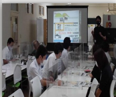
9月19日の見学説明会の様子

令和3年度山村教育教育留学生募集説明会に県内4組のご家族に参加いただきました新型コロナ対策で県内限定での開催となりましたが 今月から県外の生徒、保護者の方にも参加いただく予定です。