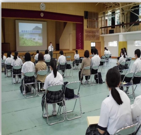
只見高校での全体説明の様子