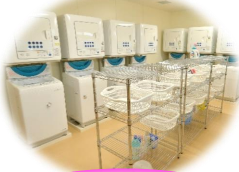
ランドリールーム

学習室は何時でも利用可能です。パソコン、プリンターも設置されているので、編集した文書や、Webで調べたものを印刷できます。（男女各寮共）