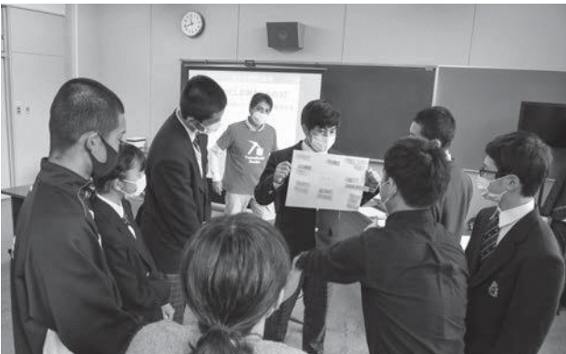
▲講演内で作成した偏愛マップで他己紹介を行い、お互いの理解をふかめる生徒