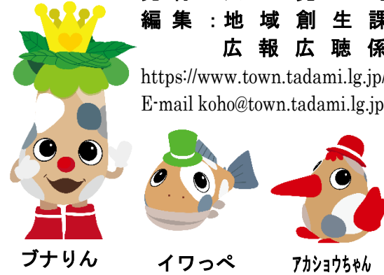
プナリン イワッペ アキョウちゃん

只見線（会津川口～会津宮下）代行バス「運転」実施について 只見線の橋りょう修繕工事を、11月16日（月）～20日（金）の期間で実施します。 このため、同期間において会津川口駅～会津宮下駅間の列車を区間運休し、バスによる代行輸送を行いますのでご了承ください。 〈地域創生課〉 クマにご注意ください この秋、全国各地でクマに襲われる被害が発生しており、只見町内でも数多くのクマの出没が確認されています。特に栗林付近で多く目撃されていますので、近くを歩いている方はご注意ください。 また、キノコが採れる時期となります。入山する際は、十分に気を付け、鈴やラジオなどを身に付けておくこともできるだけ複数人で行動するようにしてください。 朝方および夕方に田畑で作業をされる方も、鈴やラジオなどを身に付けるなどの予防策をお願いします。