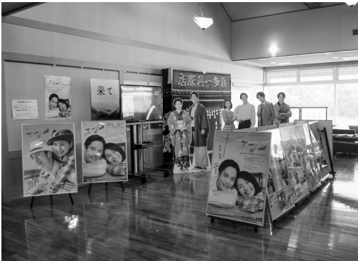
▲出演者の等身大パネルやポスターが展示されました。

湯ら里へ来館された多くの方が、足を止め、ドラマの雰囲気を感じながら、見入っていました。