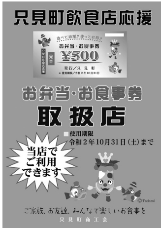
◀取扱店で掲示しているポスター

このお食事券は、町内の飲食店等で利用でき、店内飲食のほか、テイクアウトでも使用ができます。使用できるお店は、取扱店のポスターが掲示されています。使用に当たって、おつりは出ませんのでご注意ください。なお、使用期限が令和2年10月31日(土)までとなっておりますので、お早めにご利用ください。