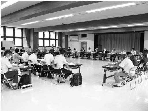
▲今年度は、新型コロナウイルスの影響で7月開催となりました。

その後、各課長から今年度の事業などについて説明が行われ、また各区長からも質問や提案が出され、活発な意見交換の場となりました。