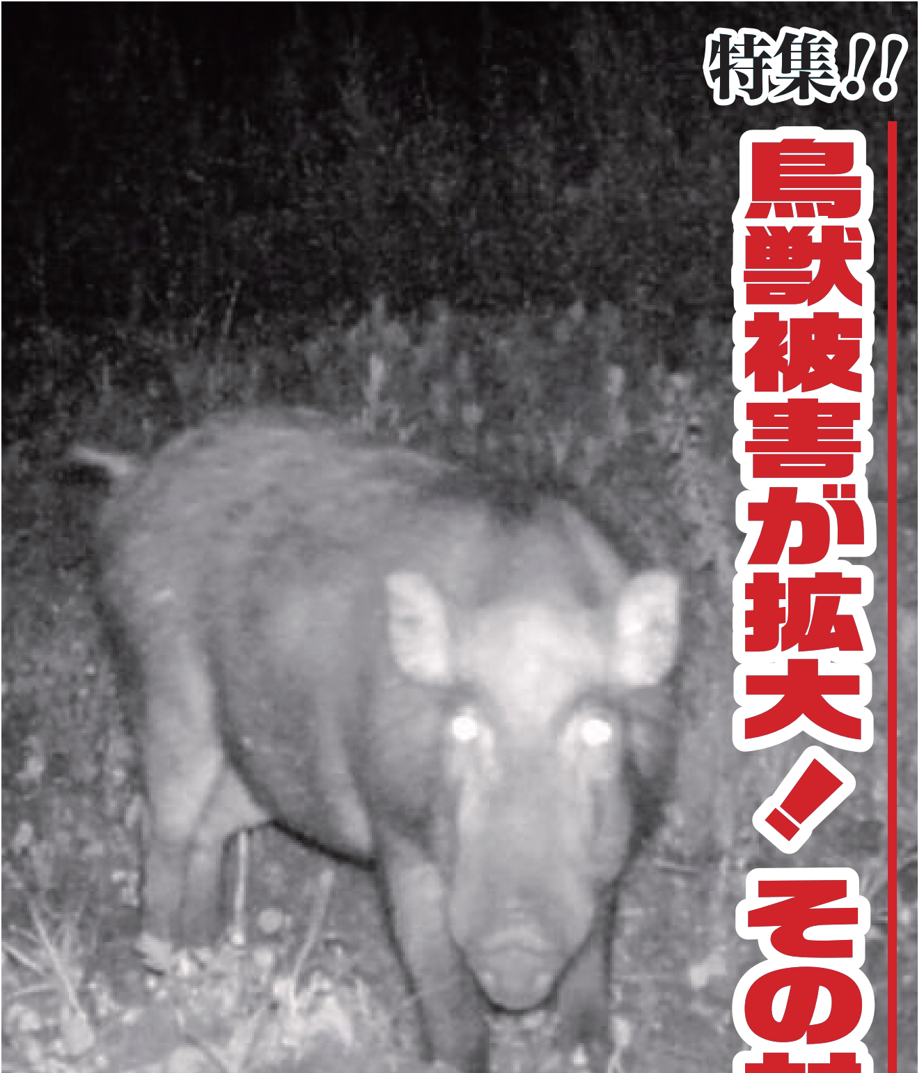
センサーカメラが捉えたイノシシの姿

今年には浅雪により、農作物などへの鳥獣被害が拡大しています。生活圏と山林が隣接している周囲で、ニホンザル、ツキノワグマ、イノシシ、ニホンシカなどの被害が拡大しています。