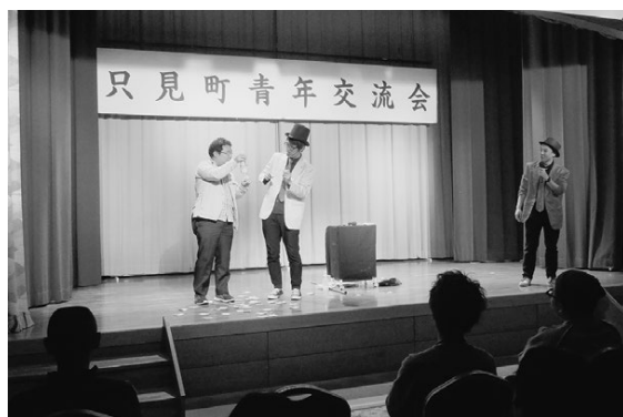
▲「あっけらかん」の2人がマジック漫才を披露

当日は、テーブルマナー講座(和食)やマジック漫才の披露などが行われ、参加者は楽しいひとときを過ごしました。