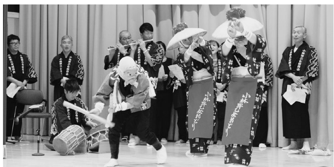
▲「小林早乙女踊り保存会」の皆さんによる実演