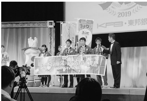
▲壇上でCM作品の紹介をする高校生と関係者(審査会会場にて)

残念ながら、審査会での入賞とはなりませんでしたが、CMを通じて町の魅力を広く発信するとともに、パソコン部にとっては企画から撮影、編集までを独自に行い、1つの作品を作り上げた非常に貴重な機会となりました。