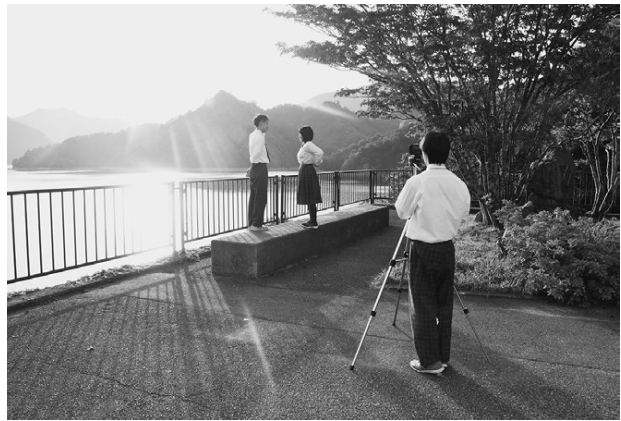
▲生徒による撮影の様子(田子倉レイクビュー)

今年は、只見高校パソコン部がCM作成を行い、出演者も生徒や先生が務めました。CMは、大ヒット映画『君の名は。』(2016年)を参考に、短いカットでテンポよく町内の美しい風景や観光施設などを紹介する内容となっています。