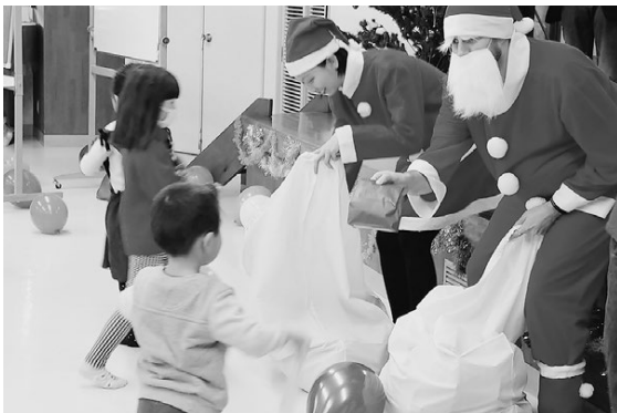
▲会の冒頭にはサンタクロースが登場

12月1日、毎年恒例となっている「朝日クリスマス会」(主催：朝日地区地域づくり委員会)が朝日振興センターで行われ、町内から約40人の子どもたちと保護者の皆さんが参加しました。