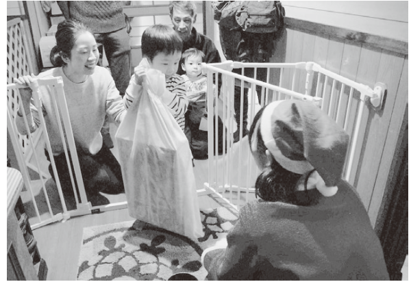
▲サンタさんからプレゼントを受け取る子供

このほか、数団体のサンタクロースの姿も見られ、クリスマスイブの只見町では多くのサンタさんが往来した1日となりました。