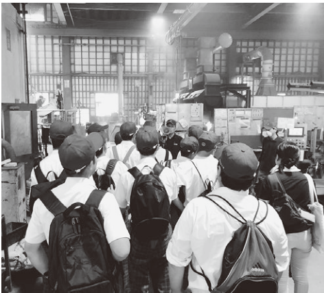
▲(株)会津工場の作業現場を見学する生徒たち

7月31日、只見高校2年生を対象に、町が主催する就職説明会が開催されました。同説明会は、町外に出る若者が増えている中、町内への就職希望者の増加を目的として昨年度から行われています。参加した高校生12人は町内企業4社（こぶし苑、(株)ヒロタテクノ、(株)会津工場、(株)南会西部建設コーポレーション）と役場で、仕事や実際の作業について説明を受け、それぞれの仕事の魅力や難しさなどを学びました。町では、町内企業などと連携しながら、引き続き雇用対策に力を入れていく予定です。