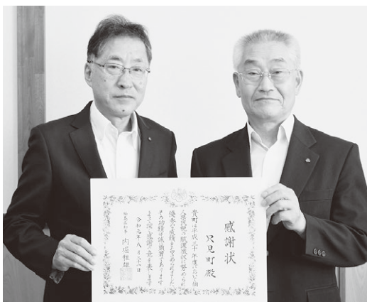
▲感謝状を手渡した金子局長（左）

8月21日、個人県民税の納付について、優良な成績を収めた自治体に対する知事感謝状贈呈式が役場で行われ、只見町に感謝状が贈られました。今回の表彰は、平成30年度分が対象でしたが（納付率99・9%）、本町は例年、非常に高い納付率を維持しており、感謝状の贈呈を受けています。 当日は、金子隆司南会津地方振興局長が来庁し、菅家町長に感謝状を伝達しました。 今年度（令和元年度）分については完納を目標に、これからも計画的な納付へのご協力をお願いいたします。