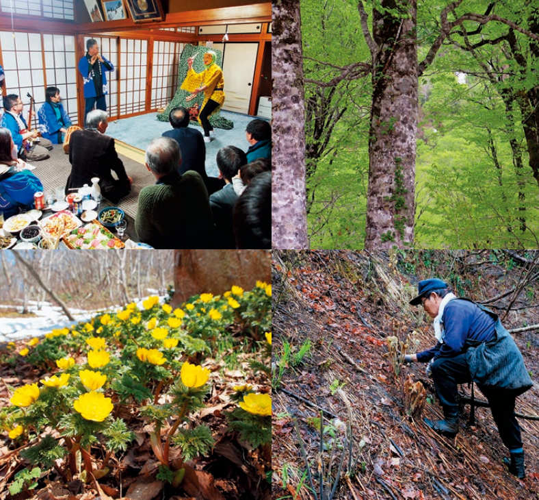
▲左上：小林神楽、左下：黒谷のフクジュソウ、中上：ブナの天然林、中下：ゼンマイ折り、右：春の浅草岳