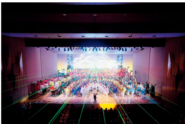
▲全国屈指の強豪校である柏高校吹奏楽部