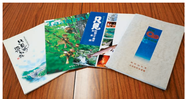
▲町制施行20～50周年時に発行された記念誌