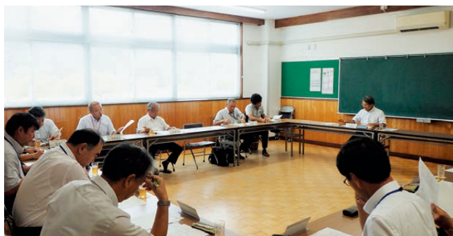
▲昨年度開催された企画運営委員会の様子

只見町は、昭和34年8月1日に町制を施行して以来、令和元年をもって満60年を迎えます。本号では、町民の皆さんと一緒に祝いができるよう、式典や記念事業などの内容についてご紹介いたします。