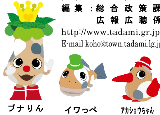
ブナリン イワっぺ アカショウちゃん