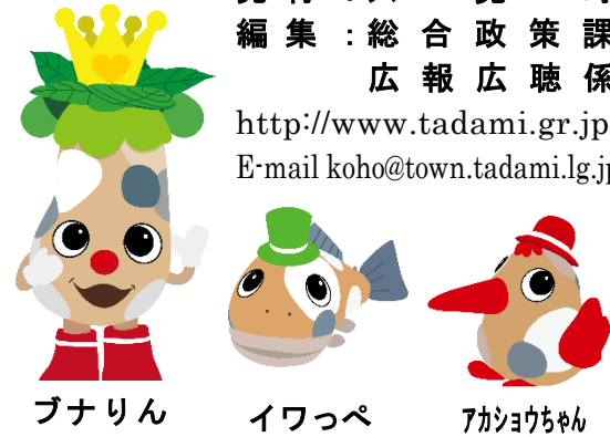
ブナリン イワッペ アカショウちゃん