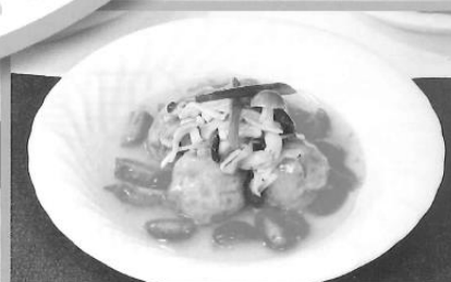
福島うまいもの丸ごと きのこヘルシーバーグ 福島県 伊藤紫音 様 (第1回福島県きのご料理コンクール最優秀賞受賞作品)