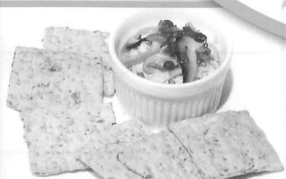
きのこのクリームディップ ～まいたけクラッカー添え～ 栃木県 岩崎尋乃 様 (平成28年度林野庁長官賞受賞作品)