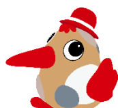
アカショウちゃん