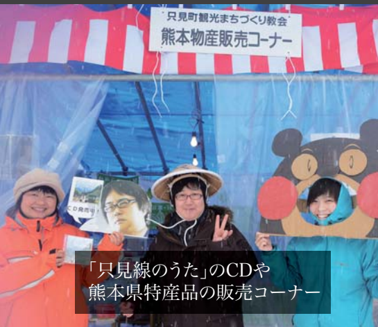
「只見線のうた」のCDや 熊本県特産品の販売コーナー