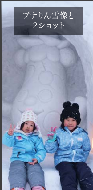
ブナりん雪像と 2ショット