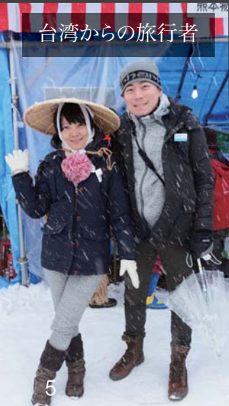
台湾からの旅行者

厄払いの儀、祈願花火大会など多くのイベントが催されたと共に、ゆきんこ市の多彩なメニューが、訪れた来場者をもてなしていました。 このように、第45回只見ふるさとの雪まつりは、開催に関わる全ての方々のご協力により大成功に終わることができました。皆様のご来場誠にありがとうございました。