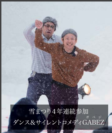
雪まつり4年連続参加 ダンス&サイレントコメディGABEZ