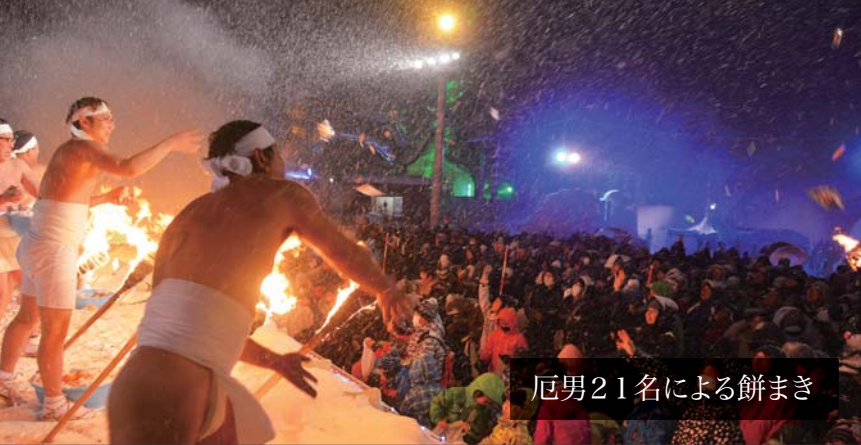
厄男21名による餅まき