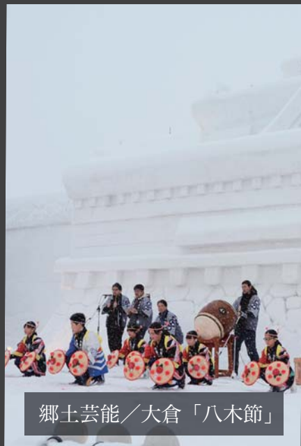
郷土芸能／大倉「八木節」

厄払いの儀、祈願花火大会など多くのイベントが催されたと共に、ゆきんこ市の多彩なメニューが、訪れた来場者をもてなしていました。 このように、第45回只見ふるさとの雪まつりは、開催に関わる全ての方々のご協力により大成功に終わることができました。皆様のご来場誠にありがとうございました。