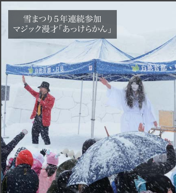
雪まつり5年連続参加 マジック漫才「あつけらかん」