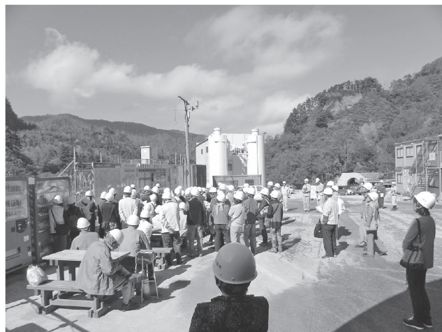
▲さらに多くの皆さんに参加して欲しい通り抜けイベント

今後は、「八十里体感バスツアー」の夏季の落ち込みにテコ入れし、1年でも早い開通に繋げるとともに、観光や産業振興、教育など幅広い分野にわたって一体的な取り組みを行い、近い将来民間事業者などを主体とする「三条市・只見町連携戦略会議」に格上げしたいという構想を描き始めているところです。