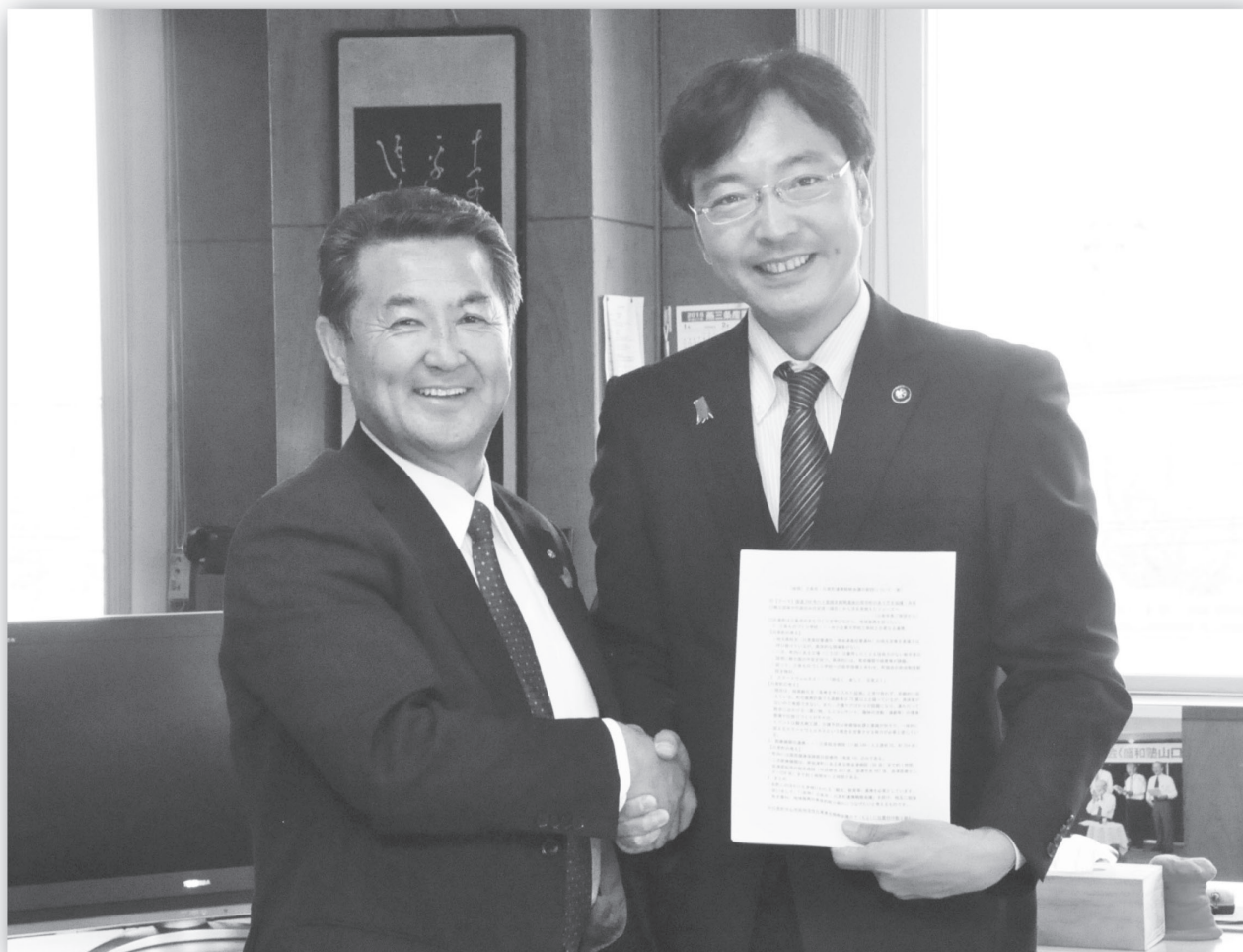
▲合意に至り握手をする目黒町長と国定市長(右)

国道289号(八十里越)は、現在まで早期全線開通を目指し、商工団体や行政が中心となって活動を展開してきました。