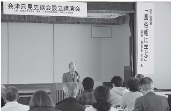
▲今では行っていない決まりごとなどを知れた貴重な講演会となりました