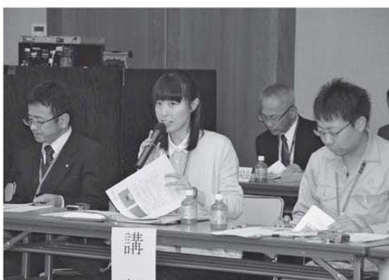
▲農林事務所の方を講師に招きマイマイガの被害対策を学びました

町政報告会では、今年度の事業について担当課長より説明を行い、その後区長の皆さんからは、事業に対する意見や要望などが発言され活発な意見交換が行われました。