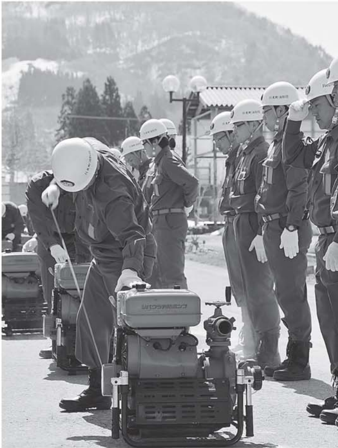
▲機械器具の点検を行う団員