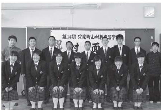
▲夢や目標を叶えるため3年間頑張ってください!

対面式では、教育長などから歓迎のあいさつがされた後、生徒一人ひとりが「野球を頑張りたい」「将来は消防士になりたい」などしっかりと夢や目標を自己紹介の中で話してくれました。