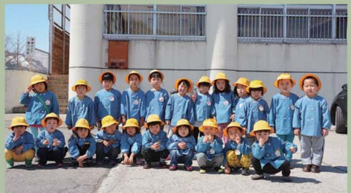
△皆さんも、僕たち、私たちのように只見線に手をふってください！

今月の表紙は再開通のお祝いとして、只見保育所の子どもたちが只見線に手をふる様子を撮影した写真です。子どもたちは、列車が見えると「来た！来たあ!!」と言って緑色の車両に向かって両手で力いっぱい手をふってくれました。