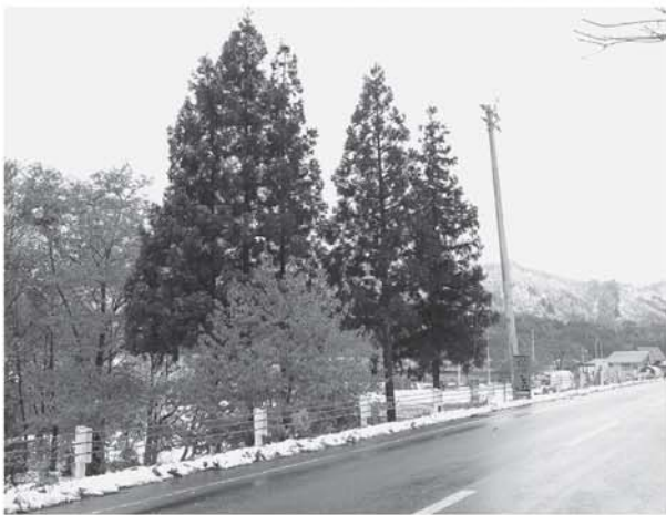
▲整備前は中央に大きなスギがありますが…

これにより景観が整備されたとともに、植栽木を伐採したことで道路への日当たりがよくなり、冬季の雪解けを助ける効果があると考えられます。