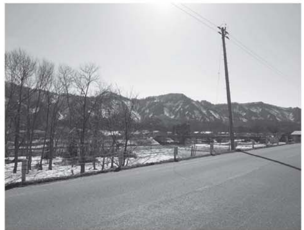
▲整備後はスギが無くなり景観も良くなりました