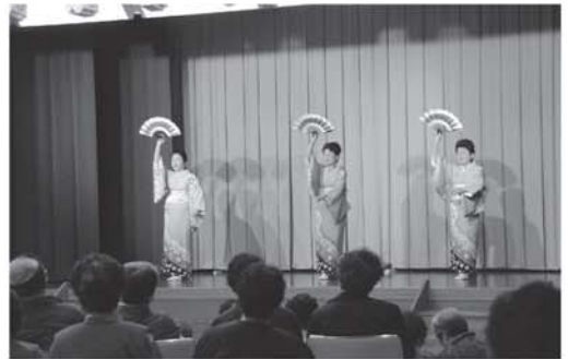
▲今年も会場はたくさんのお客さんで埋めつくされ、披露される踊りに会場からは惜しみない拍手が送られました