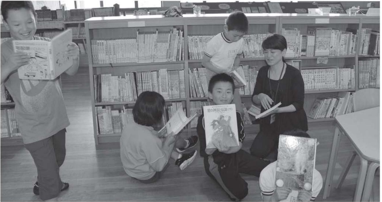
▲ブックソムリエと一緒に読書を楽しむ小学校の子ども達