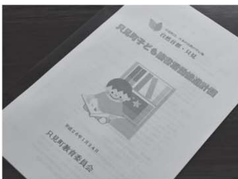
▲教育委員会で策定した「子ども読書活動推進計画書」