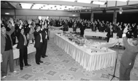
▲新年交歓会・祝賀会