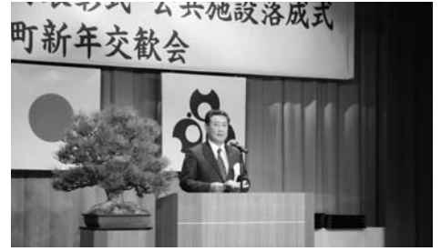
▲式辞を述べる目黒町長