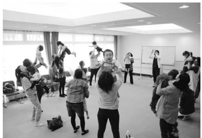
▲ 子どもと一緒に運動をするお母さん

子どもの発達を促す遊びを楽しく学ぶ「あそびの教室」が9月26日に保健福祉センターで開かれ、保育所入所前の幼児とお母さんなど26名が参加。鳴き声を聞いて動物の名前を当てる遊びや、子どもを抱いての運動を音楽に合わせて行いました。参加されたお母さんからは「楽しく子どもと触れ合えて良かった。子どもも喜んでいたので、今後も積極的に参加したい」と笑顔で感想が聞かれました。