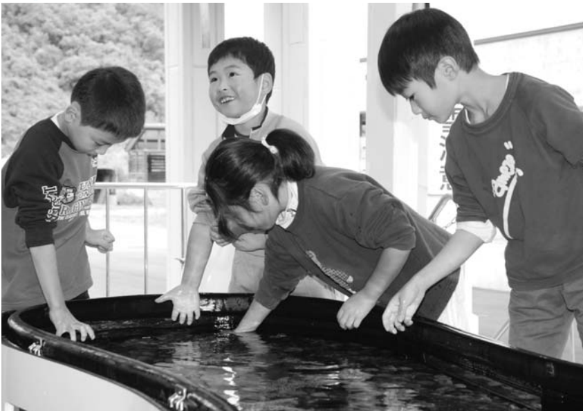
▲ 生きた海洋生物に触れる只見小学校の児童

東日本大震災で被災したアクアマリンふくしまで只見高等学校の生徒がボランティア活動を行なったことがきっかけで、10月17日、同校に移動水族館「アクアラバン」が来校し、生徒がタッチ水槽でカニやヒトデなどの生物と触れ合いました。18日には明和小学校と朝日小学校、19日には只見小学校へ移動し、各小学校の児童も生きた海の生物と触れ合いながら命の尊さを楽しく学んでいました。