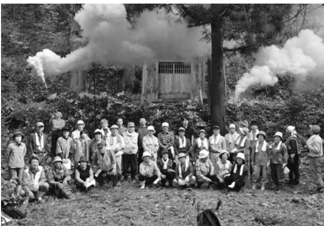
▲ 会津五街道ウォーキング実行委員会などが主催

秋晴れの10月23日に、布沢地区から昭和村に続く吉尾峠でウォーキングが行われ、73名が参加しました。登り口を出発した参加者は、途中、鎌倉沢のブナ林や吉尾集落跡などを散策、峠頂上の紅葉を満喫したあと、からむし織りの里で開かれた「昭和村秋味まつり」を見学。昭和村の新そばなどを味わいました。また、まつり会場では参加者全員による「会津から元気を！」の交流宣言も行われました。