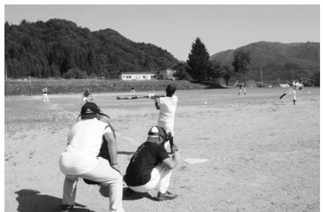
▲ 帰省者も懐かしい想いを胸にプレー

8月16日、明和地区恒例のお盆帰省者歓迎野球大会が明和小学校グラウンドで盛大に行われました。明和全集落から7チームの参加があり、熱戦に続く熱戦で多くの試合がジャンケンによる勝敗決定という高レベルでの実力均衡戦でした。見事優勝したのは梁取チームでした。最高気温36℃という夏空のもと、明和地区皆さんの元気なパワーみなぎる楽しい一日でした。