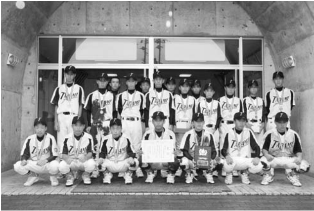
▲ 第3位に輝いた只見中スポ少Aのメンバー

紅獅子旗を懸けた県少年野球選手権大会が8月8～9日、本宮市などで行われ、只見中スポ少Aが見事、第3位になりました。9日の準決勝では安積中Aと対戦し惜しくも敗れましたが、参加414チーム中の第3位はすばらしい成績です。この大会は県内7地区の予選を勝ち抜いた16チームがトーナメントで優勝を争いました。只見中には賞状や銅メダルなどが贈られました。