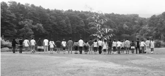
▲ この出逢いを大切に…

紅獅子旗を懸けた県少年野球選手権大会が8月8～9日、本宮市などで行われ、只見中スポ少Aが見事、第3位になりました。9日の準決勝では安積中Aと対戦し惜しくも敗れましたが、参加414チーム中の第3位はすばらしい成績です。この大会は県内7地区の予選を勝ち抜いた16チームがトーナメントで優勝を争いました。只見中には賞状や銅メダルなどが贈られました。