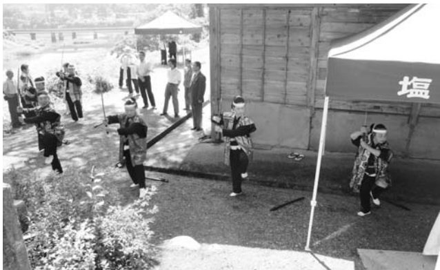
▲ 前田剣豪会の皆さんが墓前で剣舞を披露