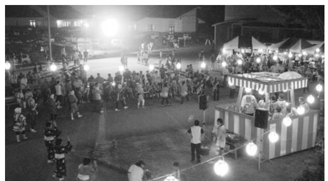
▲ お囃子が終わるまでにぎやかに踊る参加者

8月20日、長浜の福祉の里で盆踊り大会が行われました。こぶし苑、あさひヶ丘、只見ホームに入所している人たちやそのご家族、町内の各種団体や只見高校ボランティア部、各施設の職員、町民の方々が参加して、幾重にも踊りの輪をつくり盆踊りを楽しみました。お囃子は只見中学校の皆さんと明和地区老人クラブの皆さんが担当してくれました。会場内は仮装踊りが出るなど盛り上がり、入所者の皆さんもご家族や町民の方々とお話をしながら、心待ちにしていた盆踊りを満喫しました。