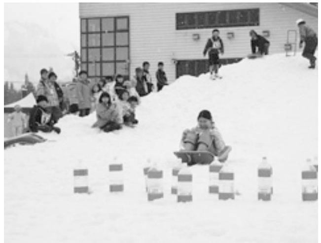
▲ 「ソリで滑ってボウリング」。目指せストライク

3月7日・8日只見スキー場で只見川電源流域振興協議会主催の奥会津雪フェスタが開かれました。大きなフワフワや雪の滑り台が設置され、スキー場が家族で楽しめるスノーアドベンチャーワールドになりました。ソリで滑ってペットボトルを倒すボウリングゲームや、雪の中に埋められた宝物をさがすゲームに、参加者は世代を越えて競い合っていました。