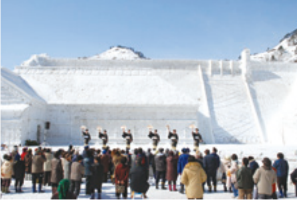
(写真上) 大雪像ステージで踊りや歌が (写真右) 鏡開きで開会 (写真下) まつりのオープニング梁取太々神楽

雪まつりは、雪を楽しもうという発想で昭和48年3月に始まりました。今では、只見といえは「雪まつり」といわれるほどになり、町の誇りの一つです。もし、雪まつりがなかったら、只見の冬は、もっと長く感じられるでしょう。まつりの様子を写真で紹介します。