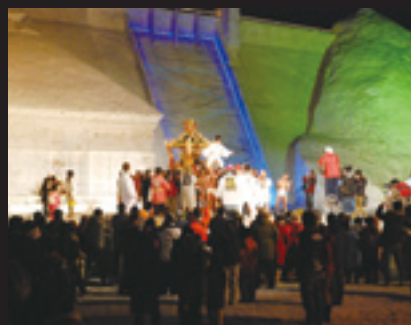
威勢のいい声が響いた雪中大みこし