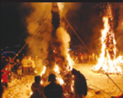
ミズノ木にさした餅を焼いたオンベ