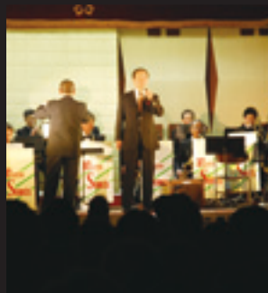
超満員だった音研歌謡ショー