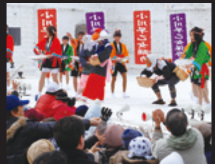
小学生も演じた小川早乙女踊り