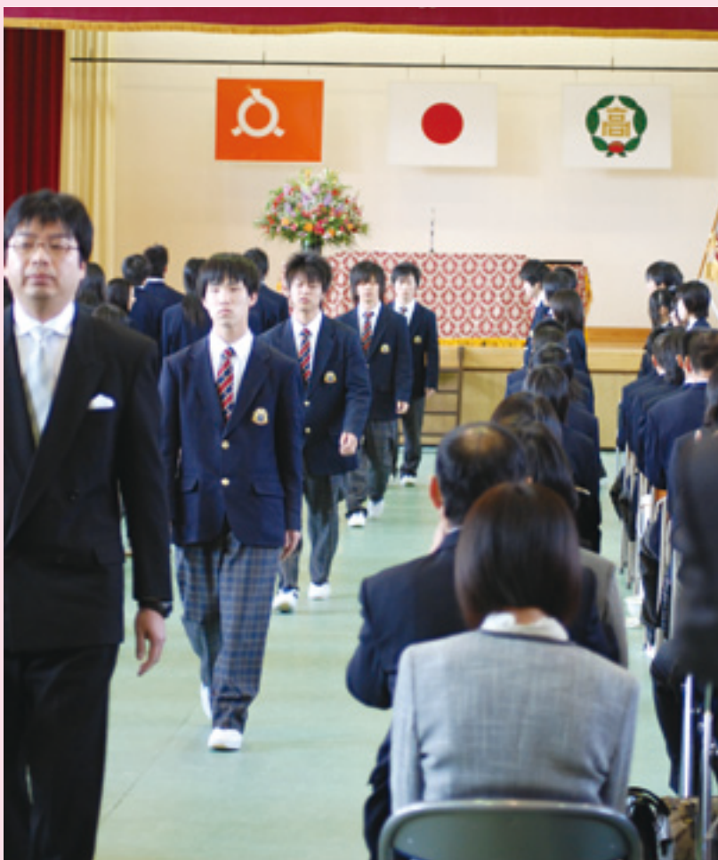
3月1日、卒業証書授与式を終え体育館を退場する卒業生。「うれしさ」と「せつなさ」が去来する。この日の只見町の積雪は、103センチ。昨年は200センチだった。今年は浅雪。