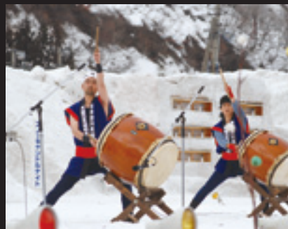
復活！天領只見仙嶽太鼓