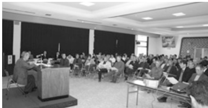
八十里越え開通は町民の長年の夢

3月8日只見地区センターで第10回八十里越フォーラムが開かれ、約150人が参加しました。主催者代表あいさつで五十嵐