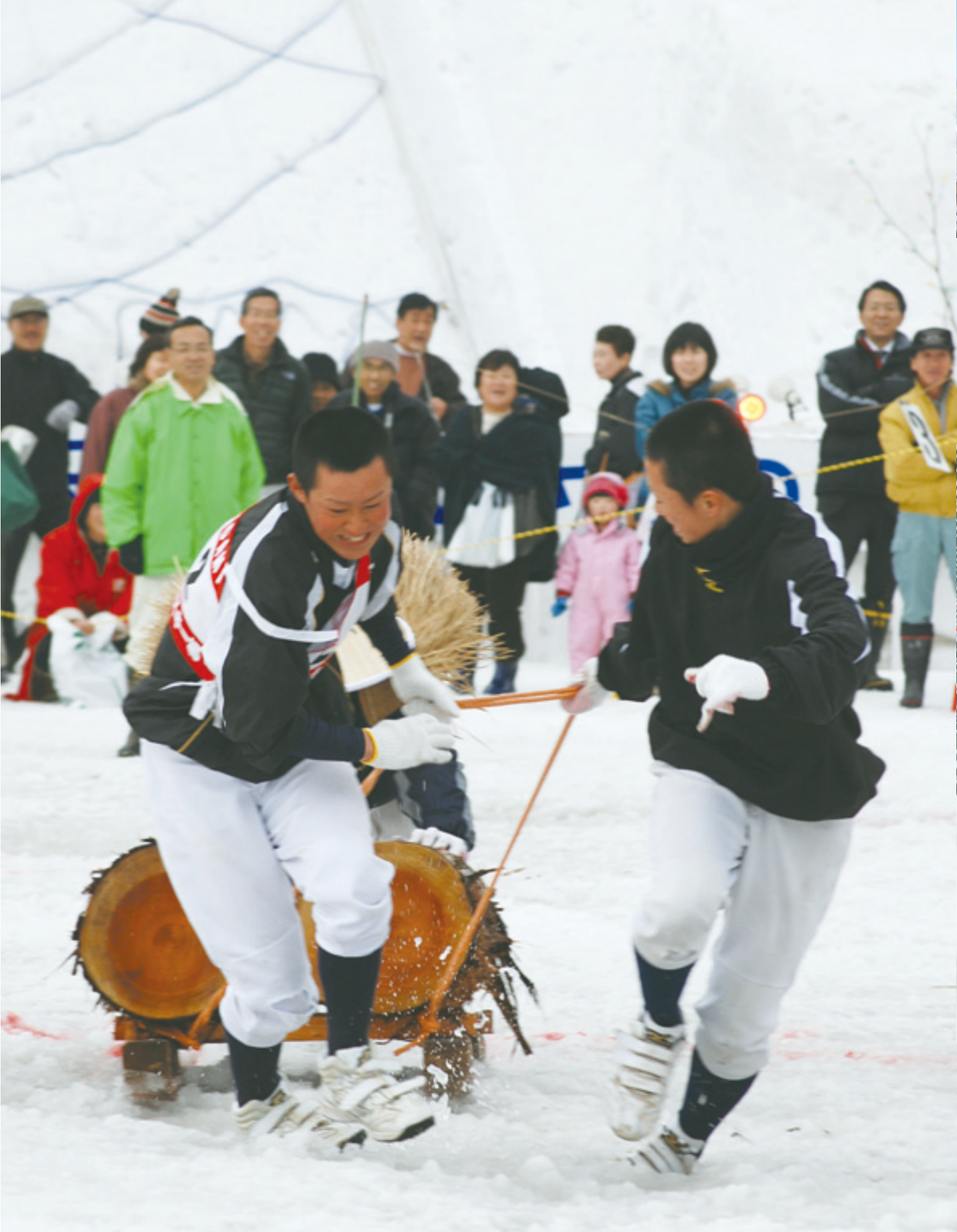
白熱した「もと山レース」。3人一組で丸太を載せた木ぞりを引き、1本の丸太を切る速さを競った。