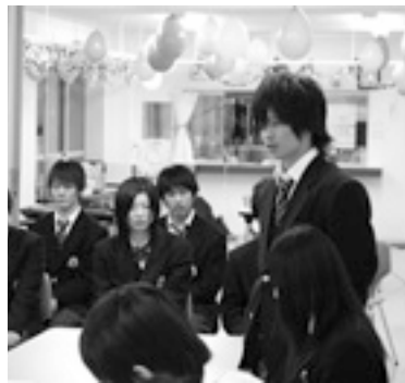
一人ひとりが三年間を振り返った

「雪国は初めてでしたが、皆が支えてくれて助かりました」、「運動部の活動をしながらだったので、辛いときもあったが、乗り越えられました。ここで寮生活を送れてよかったです」、「只見で学んだことをこれから生かして頑張っていきます」など、それぞれが三年間を振り返りました。