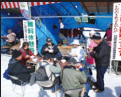
心もあたたまる雪んこ市