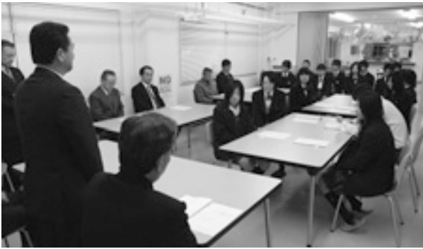
目黒町長のあいさつを聞く留学生