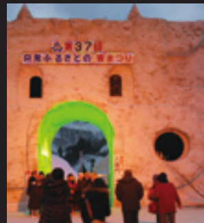
入場門は記念撮影スポット