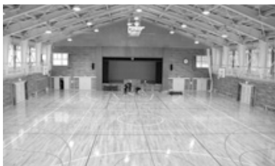
耐震改修済の只見中体育館

学校施設は万一の災害時には避難所の役割もあることから、より安全なものでなければなりません。 只見町では各学校の耐震診断を実施し、昨年までに該当する施設全ての耐震診断を終了しました。 診断で※耐震指標値（IS値）が基準に満たない建物については、順次改修し、安全な学校づくりを進めてきました。耐震補強が必要な学校施設は、只見小体育館のみとなりました。出来るだけ早期に改修を図るため、