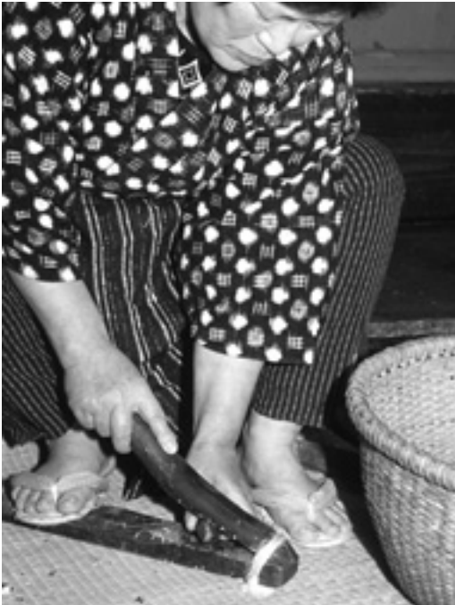
トチムキでトチの皮をむく

トチノキは、秋の彼岸頃になると実が熟し、落下します。その実は、食料として用いられ、すでに縄文時代には食べられていました。今でもトチノキが生える東北から中部日本の各地でトチの実を食べる風習が伝えられ、只見町でもトチの実の加工伝承者は多いようです。