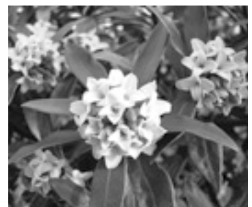
ジンチョウゲ (ジンチョウゲ科)

▼問い合わせ 国土交通省東北運輸局福島運輸支局輸送・監査部門 ☎024-546-0343