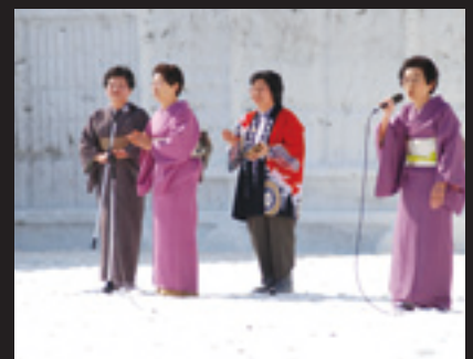
郷土芸能ステージで只見町民謡会