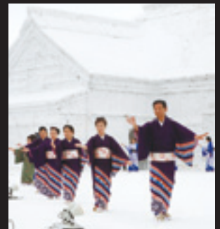
柏市民踊連盟の交流の踊り