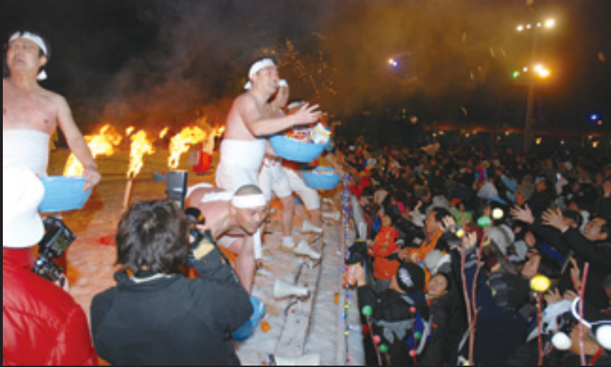
厄払いの儀。餅やみかんがまかれた