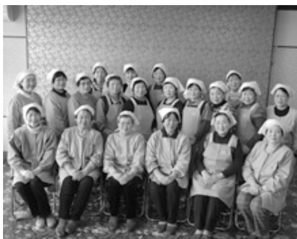
「心をこめて」食生活改善推進員会のみなさん