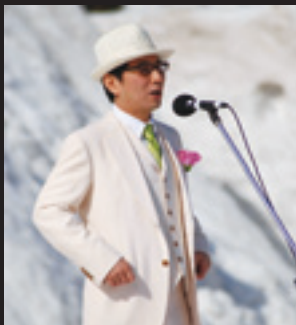
井筒Kのジャズコンサートにうっとり