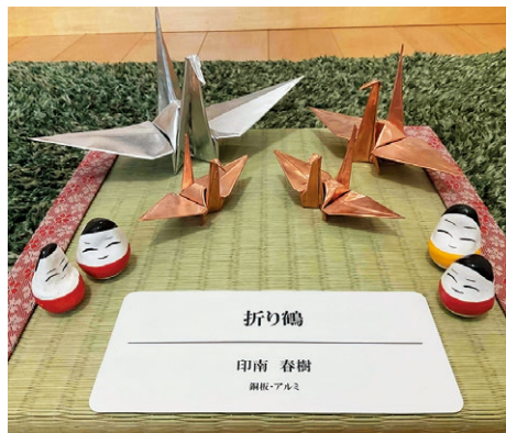
▲金属板を加工してできた精巧な折り鶴

住所：只見町小林字上前田381-5 TEL：0241-86-2546 屋根でお困りのこと、気になることがあれば、お気軽にご連絡ください。屋根の仕事に興味のある方、随時従業員募集中です。