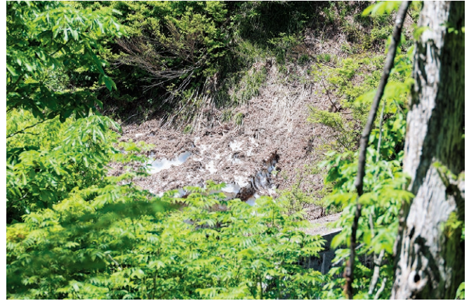
▲5月中旬。山の斜面には残雪があります。