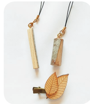
▲ブナ材クラフト体験