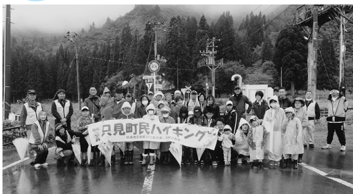
▲あいにくの雨でしたが、楽しく歩きました。

「只見町民ハイキング」(只見地区地域づくり委員会主催・只見公民館共催)が5月24日、只見線広場をスタート・ゴールに開かれ、町民約40人が参加しました。