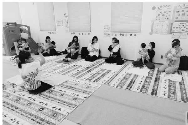
▲背中をとんとん。アイコンタクトも大切です。

かるがもクラブは本年度、全10回開催されます。参加は無料で、原則予約不要です。次回は7月8日(水)に開催予定です。