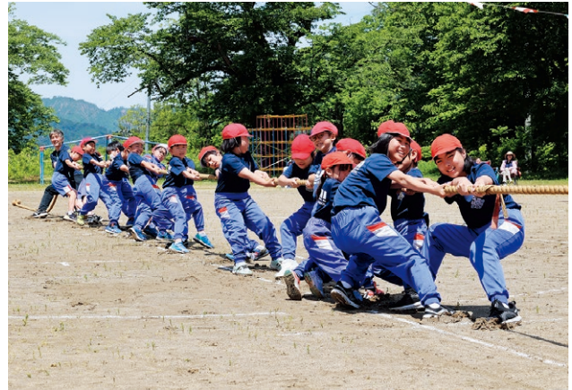
▲「全校綱引き」(朝日小)息を合わせて力いっぱい引きました。