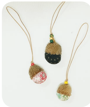
▲ぜんまい綿のストラップ