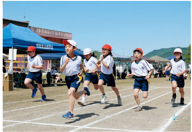
▲「明和の風になれ！！」(明和小)ゴールを目指して全力疾走！