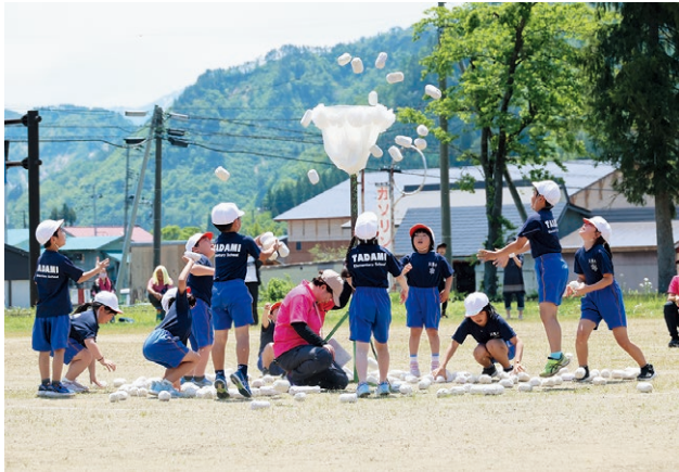
▲「ダンシング玉入れ」(只見小)カゴ目がけて精一杯投げました。