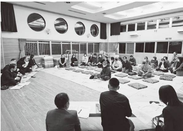
▲4月27日開催の意見交換会の様子

令和10年度中の開園を目指す「認定こども園」の施設整備に向け、3月26日と4月27日にぶなのもりこども園で意見交換会を開催しました。延べ46名の町民が参加し、建設時の安全対策や地域交流スペースのあり方など多くの意見が寄せられました。今後はいただいた意見を踏まえて基本設計を進め、大枠の仕様を決めるワークショップを開催し、さらに意見を募る予定です。なお、今後の進捗については広報紙等で随時お知らせします。