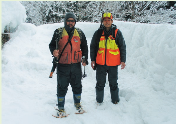
▲冬はカンジキを履いて山に入ります。

また、事前の狩猟者登録を済ませておき、11月から始まる猟期には狩猟が可能な区域内で銃猟を行います。雪が降ると獲物の足跡が残り、追いやすくなります。