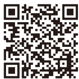
環境創造センター ホームページ