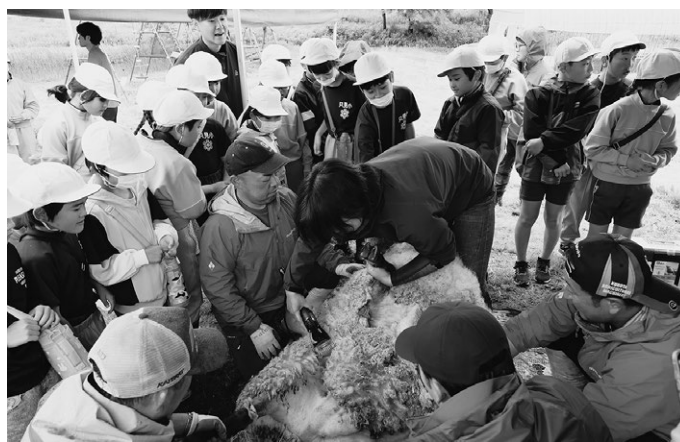
▲羊毛に含まれる油が少なく、スムーズな毛刈りでした。

3頭のヒツジ「メメ・ムム・モモ」は横に寝かせられて、バリカンで丁寧に毛を刈られていました。ヒツジは毛刈りされている最中でも大人しく、児童らはその様子や刈られた後の羊毛、ヒツジが餌を食べている様子などを興味深々で眺めていました。