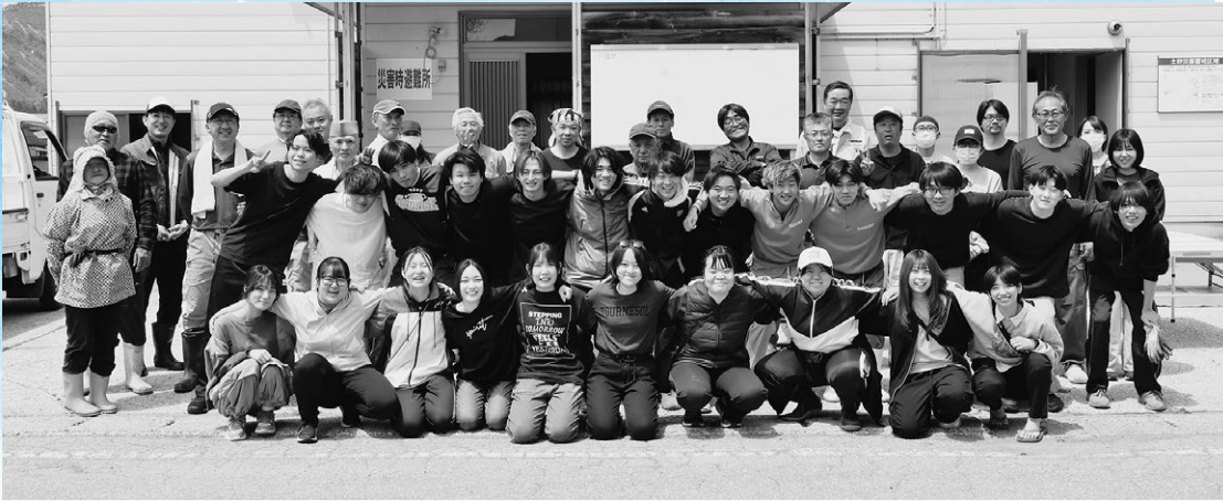
▲清掃活動に取り組んだ学生らと上福井集落のみなさん