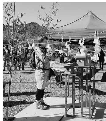
▲安全祈願を行う登山者

下山後はインフォメーションセンターで登山バッジが配られました。登山バッジは四名山それぞれのデザインが用意されており、登山をされた方に先着で配布しています。(無くなり次第終了。会津朝日岳はいわなの里で配布。他三山はインフォメーションセンターで配布)