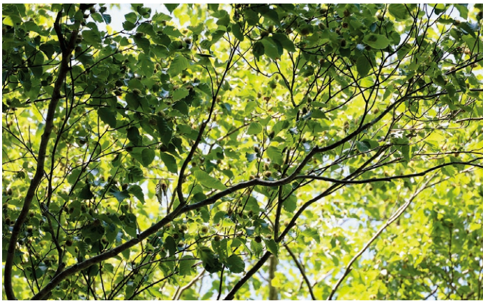
▲今年は多くのブナが開花しました。