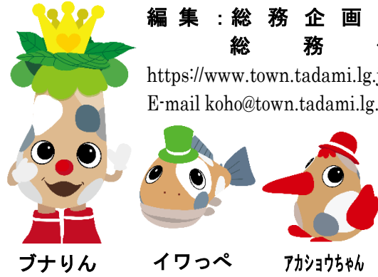
ブナリン イワっぺ アキヨウちゃん