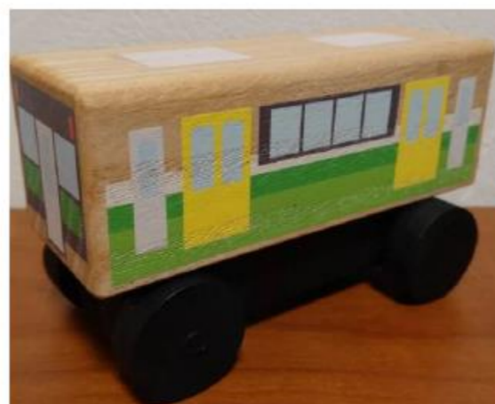
会津桐製ミニトレイン作成