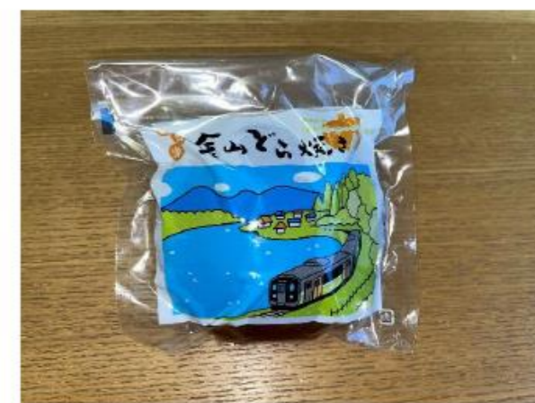
金山どらやきのパッケージ作成