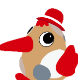
アカシヨウちゃん