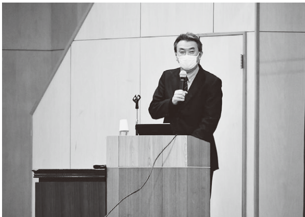
▲講演をされた中北教授

中北教授は、昨今の水害について、地球温暖化が関係していることに触れ、「避難の際は自助、共助を大事にしましょう。また地球温暖化を緩和することの大切さを改めて考えてください」と話しました。