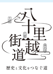
▲八十里街道 ロゴマーク