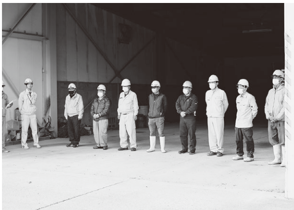
▲除雪に携わる皆様、今シーズンもよろしくお願ひします。

降雪期間は、除雪車による騒音や置き雪などご迷惑をおかけいたしますが、安全な通行を確保するための大切な作業です。ご理解、ご協力をお願いいたします。