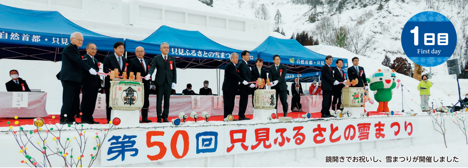
鏡開きでお祝いし、雪まつりが開催しました

1日目は、鏡開きで開会のお祝いをした後、梁取太々神楽が披露されました。その後は町内の芸能団体による芸能発表やアーティストのライブが会場を盛り上げました。 夜には厄払いの儀やおんべ、プロジェクションマッピング、只見線全線運転再開を記念した祈願花火が会場を彩りました。 プロジェクションマッピングを雪像に投影するのは県内初で、来場者は「雪まつりの会場で只見線の四季を堪能できるとは思わず、とても感動しました」と話しました。