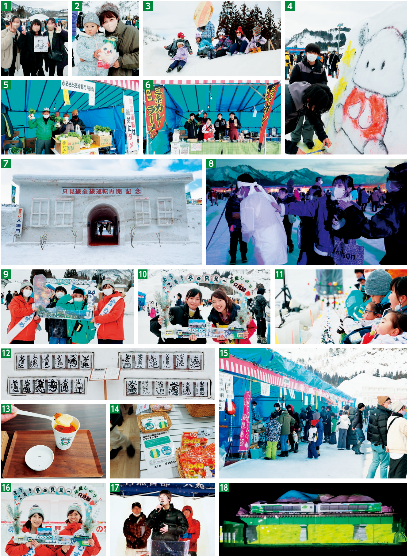
1 福もちまきでカミナリのサインをゲット 2 福もちまきでプナりんめいぐるみをゲット 3 すべり台で遊ぶ子どもたち 4 只見中SDGs委員会による「雪壁に芸術家は現れるのか」 5 柏市ブースでは柏市産の野菜の販売などが行われました 6 三条市ブースでは、市名物カレーラーメンが来場者の冷えた体を温めました 7 電源開発(株)に作製いただいた入場門 8 厄男衆の体に触れるとその年1年は良いことがあるといわれています 9 お友達と一緒に記念撮影 10 只見線フォトフレームで記念撮影 11 イベントを待つ子どもたち 12 無災を祈る伝統「火の用心」 13 14 インフォメーションセンターには只見高校生が総合的な探究の時間で考案した商品が並びました 15 お客さんで賑わうゆきんこ市 16 雪むすめのお2人もお疲れ様でした 17 前夜祭はのど自慢たちによるカラオケ大会で会場に美声が響きました 18 前夜祭のプロジェクションマッピングは降る雪と相まって幻想的でした