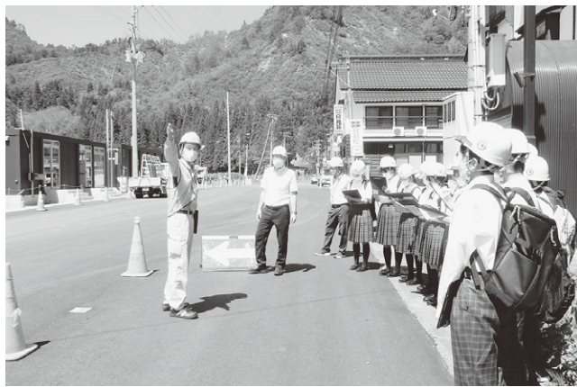
▲現場で説明を聞くことで、より仕事内容を知ることができました

農地利用の最適化を目指して「農業委員会」の選任と「農地利用最適化推進委員」の委嘱