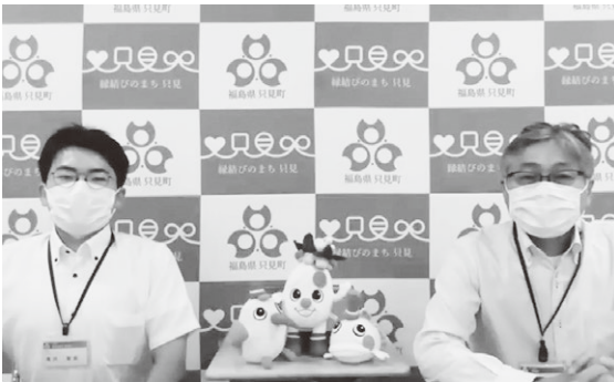
▲仕事のやりがいを伝えた町職員

只見町の紹介では若手職員が、自身の仕事についての紹介や働こうと思ったきっかけなどを視聴者に向けて伝えました。