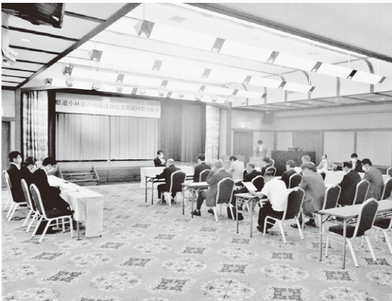
▲質疑応答なども行われ、活発な総会となりました

また、南会津建設事務所から、今年度の工事などに関する事業計画説明などが行われました。