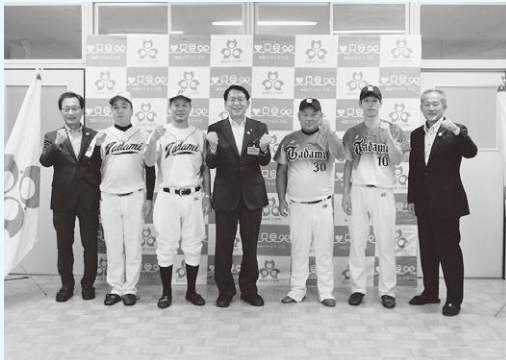
▲最後はガッツポーズで、試合への気持ちを高めました