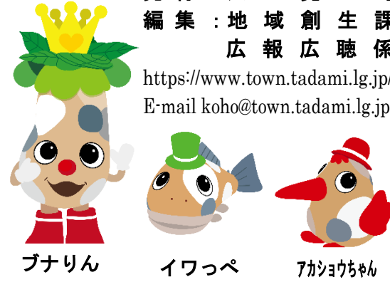
ブナリン イワッペ アキョちゃん

令和3年度只見町職員採用候補者試験を行います 只見町職員（保健師・看護師）採用候補者試験を行います。 ○職種及び採用予定人員 【資格免許職】 ・保健師 若干名 ・看護師 若干名 ○採用予定日 令和3年6月1日以降できるだけ早期（令和3年度内） ○受験資格（学歴不問） ・保健師 昭和46年4月2日以降に生まれた者で、保健師（又は保健婦）の免許を有する者 ・看護師 昭和46年4月2日以降に生まれた者で、看護師（又は看護婦）の免許を有する者 ○試験の方法 【第1次試験】