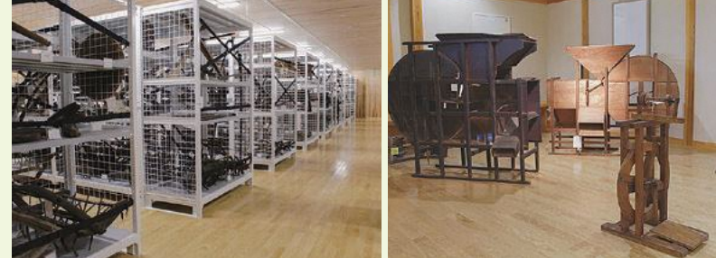
民具収蔵庫 (収蔵展示室)