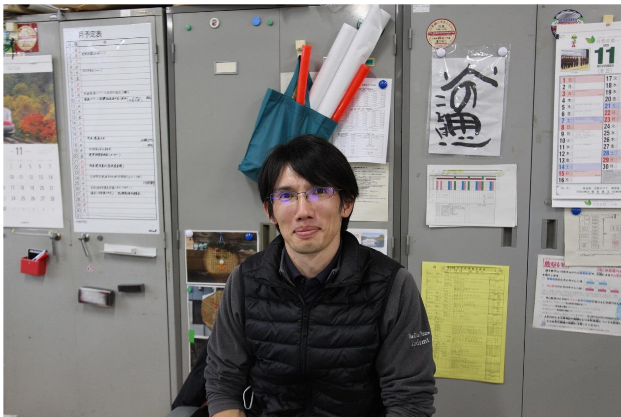
只見町役場 地域創生課 デスクにて撮影