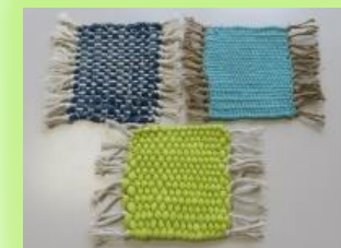
写真: 段ボール織り機でコースターを作りました!