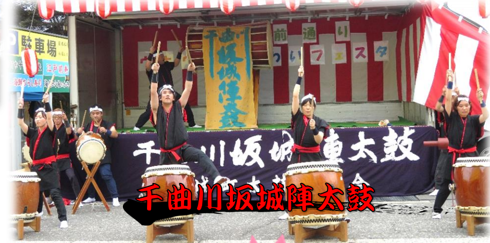
千曲川坂城陣太鼓

只見駅前通りウキウキわいわいフェスタが9月1日（日）に開催されました。新潟県三条市から『三條太鼓』の皆さん、そして長野県埴科郡坂城町から『千曲川坂城陣太鼓』の皆さんにお越しいただき、瞳の会・つくし会の皆さんと共に会場を盛り上げて頂きました。今年も皆様の寄付により開催できましたことを心より感謝いたします。