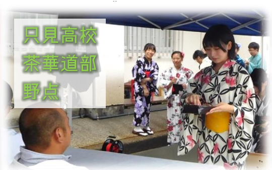
只見高校 茶華道部 野点