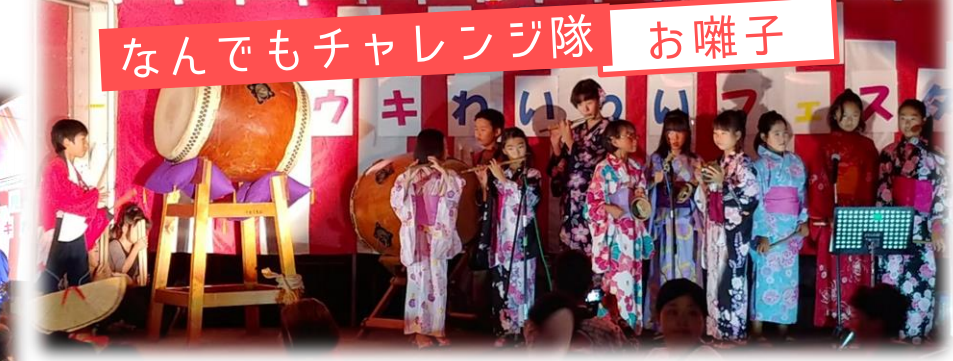
なんでもチャレンジ隊 お囃子