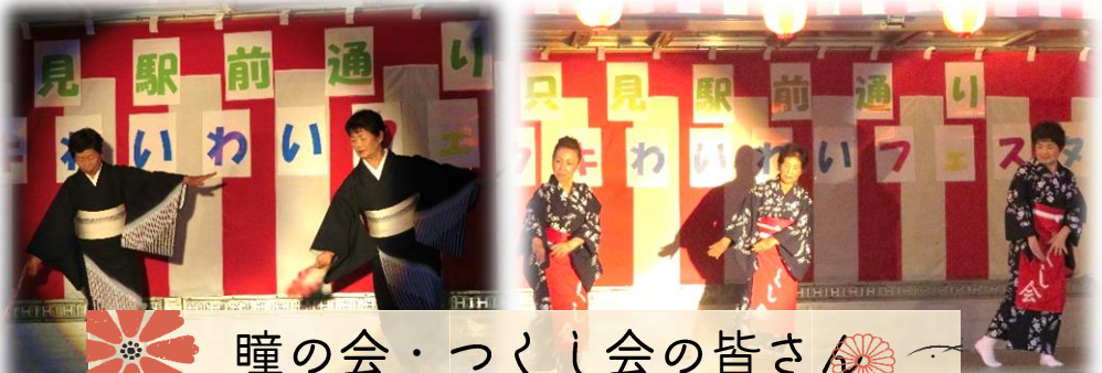
瞳の会・つくし会の皆さん ～壮麗な舞～