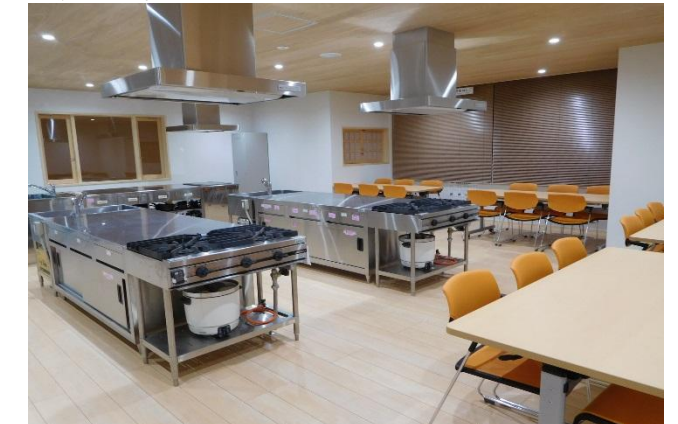
調理室 24席[2階] イベントの調理から料理教室まで「眺望」と併せて「食事」を堪能