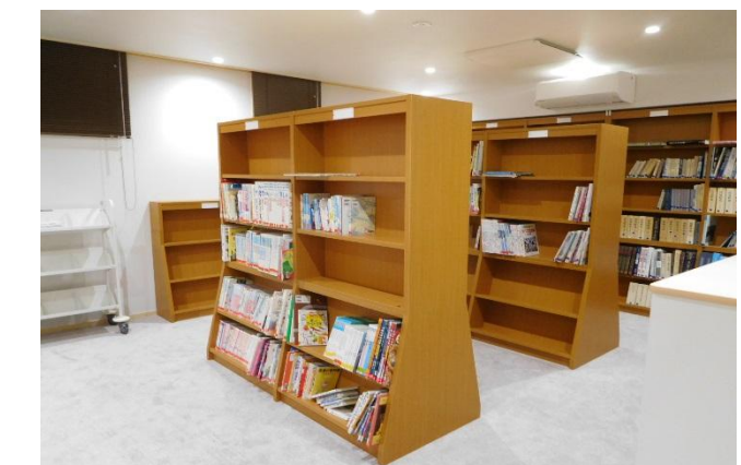
図書コーナー 6席[2階] 学習机もあり、一番奥に配置したことにより落ち着いて読書や勉強が可能