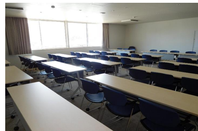
学習室2 54席[2階] コーラスに対応するため防音構造。併せて遮音カーテンを設置