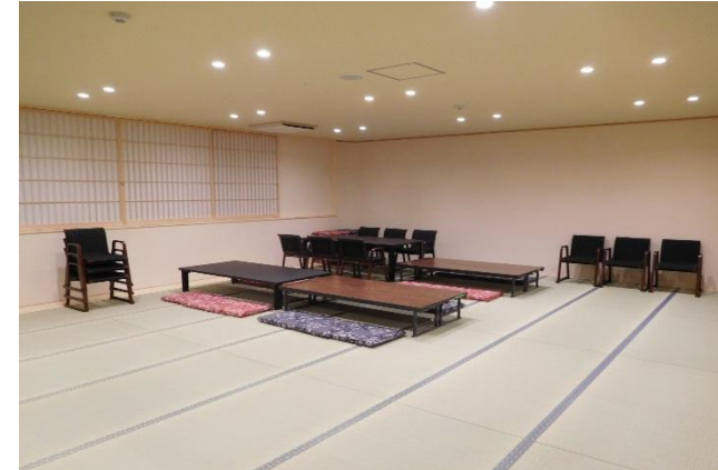
和室 72席[1階] コーナーをRにすることで、部屋が広く感じられるように工夫