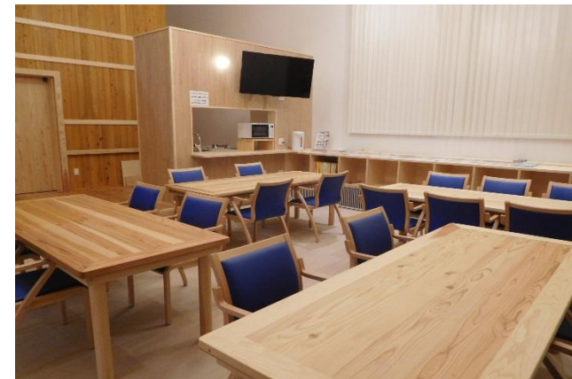
交流スペース(土間) 18席[1階] いつでも誰でも、自由気ままに使えるキッチンのあるスペース