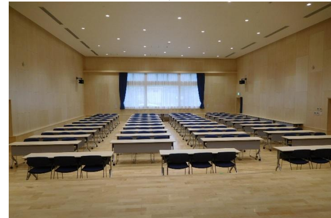
集会室 210席/机使用時129席[1階] 300人程の収容が可能。天井は高く舞台の間口は広いので、さまざまな催し物に対応