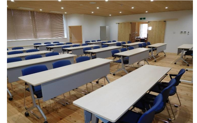
学習室1 45席[1階] 連続した空間とすることで、イベント時に広く使えるスペース