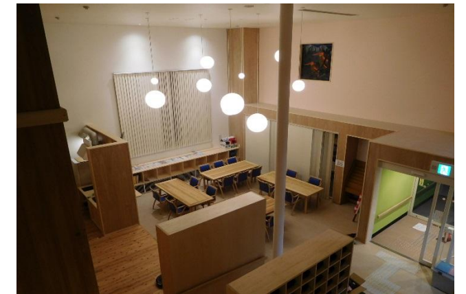
交流スペース(土間)その2[1階] 2階から交流スペースを望む